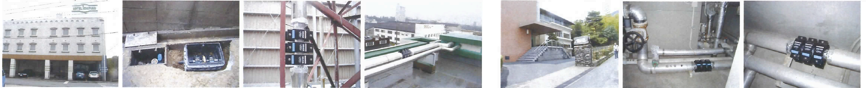
ビジネスホテル 赤水対策 40A M1-C*3set H5.7.30 取付（取水部） 50A M2*3set（揚水部） 100A M4C*3set（落水部） 〇〇会社 湯の山山荘 赤水対策 H15.9.29 取付 給水管 100A M4*3set 揚水管 50A M2*3set