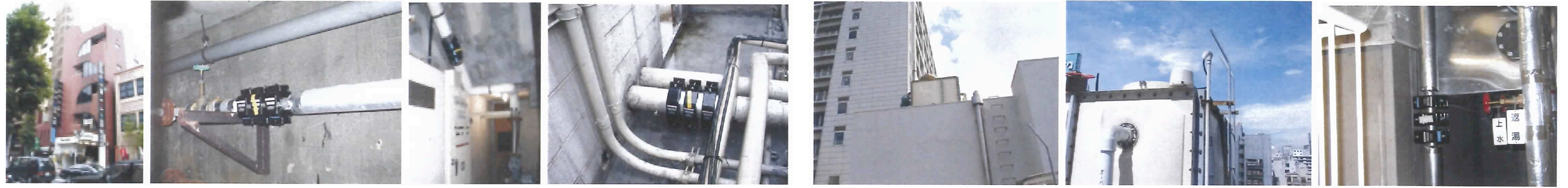
レジャービル H14.6.29 取付 赤水対策 市水取入部 40A M1-C*3set ポンプUP部 80A M3*3set 屋上 空調 C/T 回路 100A M4*3set 東京都立〇〇病院 赤水対策 H14.7.15 取付 高架水槽 送水管 50A M2*3set

ビル・マンション・病院・プール・浴場（赤水は水使用量によって差がありますが、概ね1ヶ月で解消しております。） お陰様で設置1, 400ヶ所突破しました！国内販売実績業界NO.1！！ 『マグネタイザー設置例』 省エネ・省メンテ・赤水対策・設備の長寿命化等マランニングコストの大幅削減にお役立て下さい！！ 日本特許第3902277号 取得