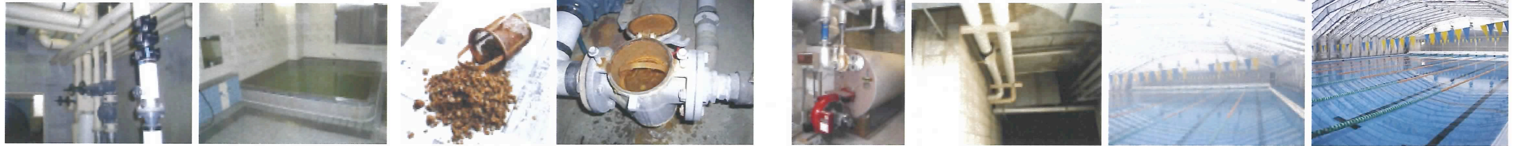
〇〇教 詰め所 浴場給湯回路 50A M2-*3set H15.2.12 取付 取付約3ヶ月後へアーキャッチャーにびっくりする程スケール一杯出る ◇◇大学・高校プール100A M4*3set H14.5.10 取付 取付前 取付後 塩素臭殆どなし 透明度抜群に向上！！