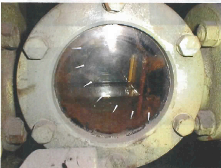
99.2.18 開放時 殆ど汚れが取れ裏側が見える

この差異は平松班長様から大変高評価を頂きました。パイプ内部も同様初回開放と比較して非常に良好でした。別紙内視鏡写真をご参照下さい