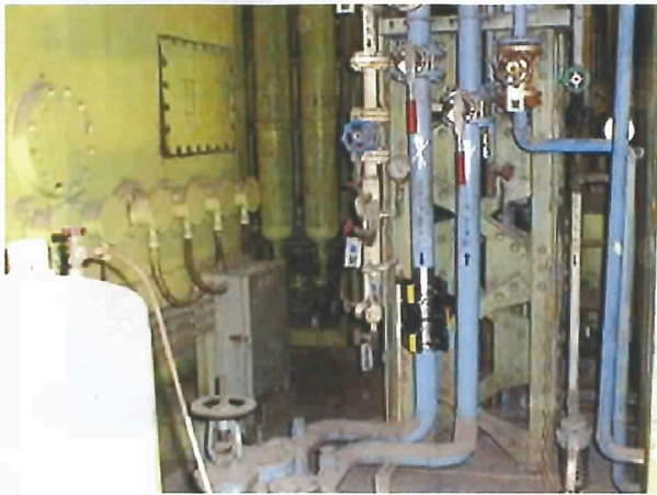
マグネタイサーM2*3set IN側に98.9.29取付時