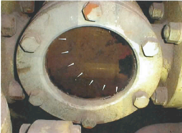
98.9.29 取付時 窓汚れひどい