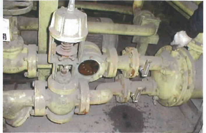
99.2.18 温度計取付部 IN, OUT2ヶ所より内視鏡観察