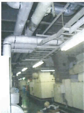
冷温水回路 機械室 取付現場

更に大型冷凍機 250A 2基、冷温水発生機 300A 1基に設置も計画されている。