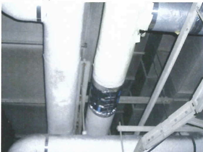
診療棟 給水管 高架水槽 in 側 100A にマグネタイザーM4*3set 診療棟 冷温水回路 150A マグネタイザーM6*3set H17.2.15 取付。赤水対策の効果実績を評価され2ヶ所にスケール除去・防錆対策・メンテ軽減で追加採用されました。

更に大型冷凍機 250A 2基、冷温水発生機 300A 1基に設置も計画されている。