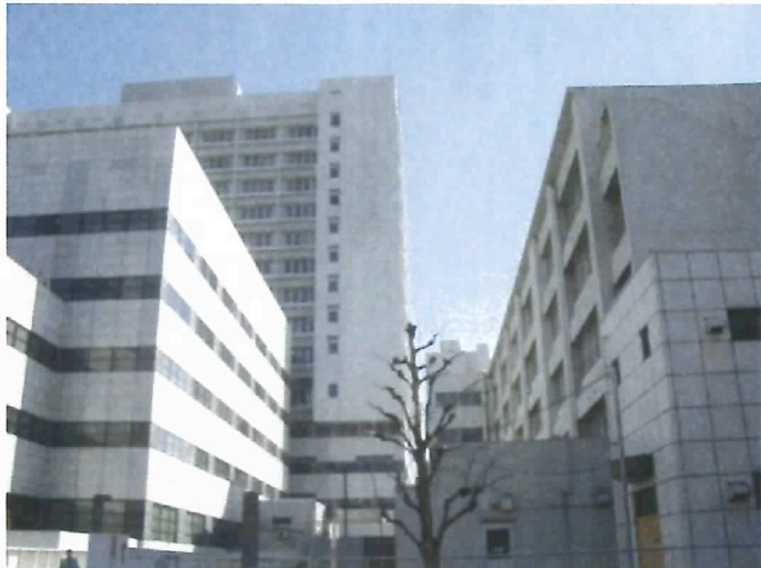
病院全景 右がわかば寮（5階建）、左側手前が診療棟、その奥が14階建病棟（770ベッド超 平成11年築）

わかば寮：マグネタイザーM2*3set H14.7.15 取付 診療棟：マグネタイザーM4*3.M6*3 各 3set H17.2.15 取付